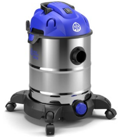
AR BLUE CLEAN 36 SERIES 3670