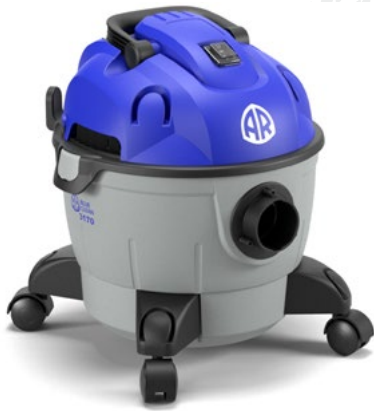
AR BLUE CLEAN 31 SERIES 3170

Maneggevolezza, trasportabilità e facilità di utilizzo sono le prerogative di tutti i prodotti AR Blue Clean; le stesse con cui Annovi Reverberi realizza gli aspiratori e gli aspiraceneri, al fine di creare strumenti dalla massima efficienza e praticità.