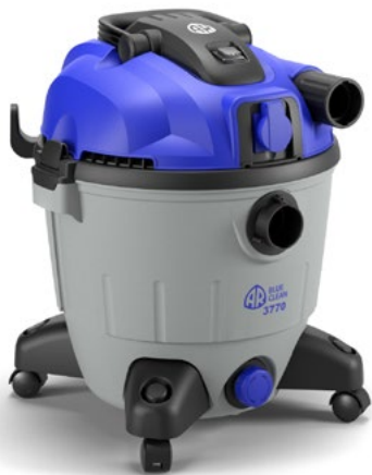
AR BLUE CLEAN 37 SERIES 3770