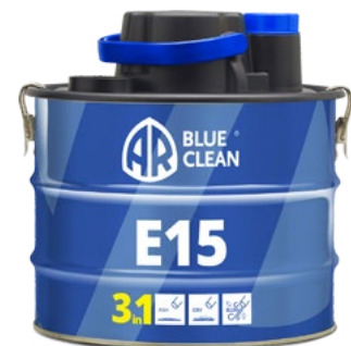
AR BLUE CLEAN E15