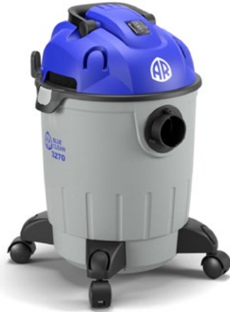
AR BLUE CLEAN 32 SERIES 3270