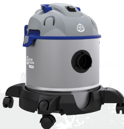
AR BLUE CLEAN M20