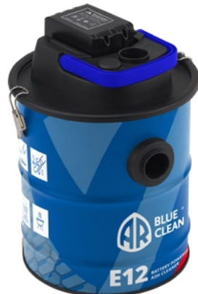
AR BLUE CLEAN E12B